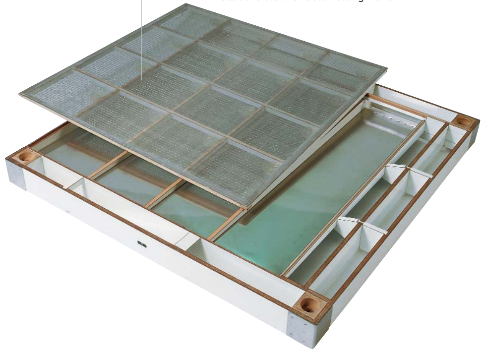
Particolare dello staccio con telaio portavelo Detail of sieve with sieve holding frame

On request, the machine is supplied with 2 inlets by dividing the scheme horizontally for two different sifting passages.