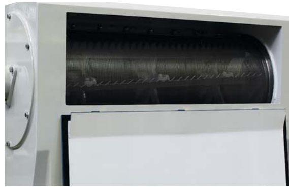
Mantello per scarti pulitura Cover for cleaning screening