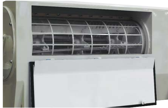
Mantello per ripasso farina Cover for flour redressing

The machine is provided with an inspection door. The centrifugal motion impressed by the rotor keeps the sifting surface constantly active, for an intensive yield.